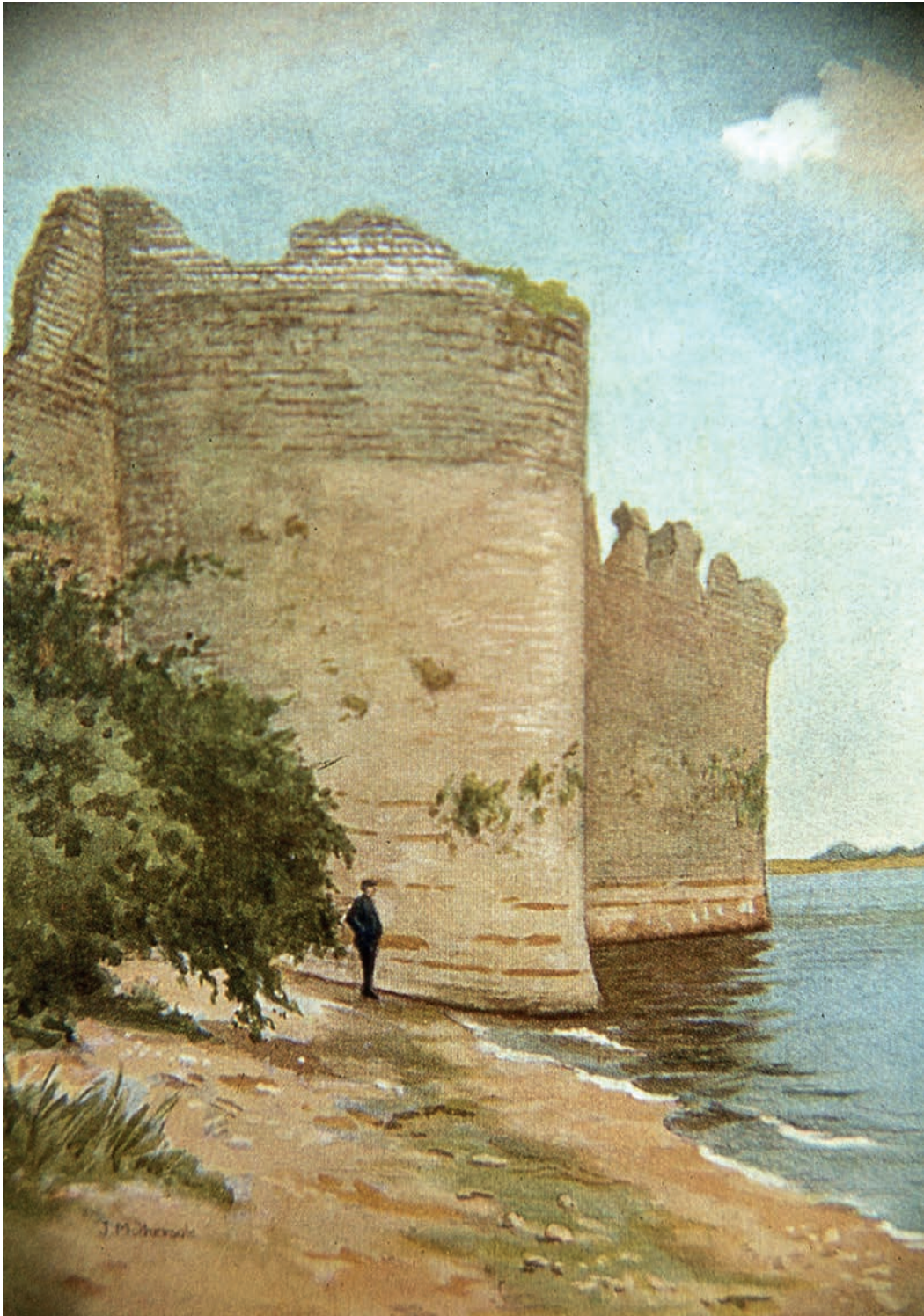
1. South wall of Portchester Castle, showing the easternmost bastion, and the south-east angle. Painting by Jessie Mothersole, 1923

Le mur sud de Portchester Castle, avec le bastion le plus à l'est, et l'angle sud-est. Peinture de Jessie Mothersole, 1923